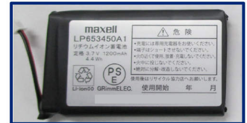
リチウムイオン標準パック (日立マクセル)