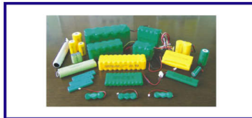
ニカド・ニッケル水素組電池 (WELL LINK)(三洋GS)(古河電池)